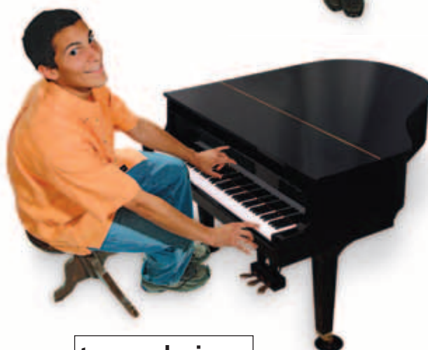
tocar el piano