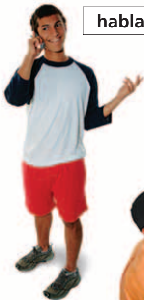
hablar por teléfono