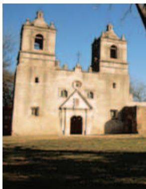
a la iglesia