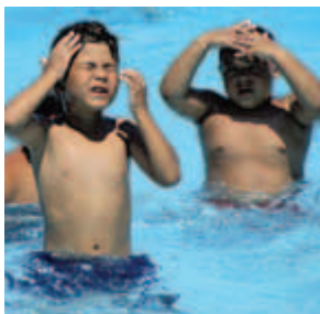
a la piscina